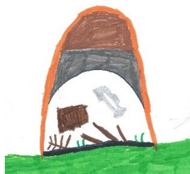
Suche nach der Besitzurkunde der Burg (Marlene M)