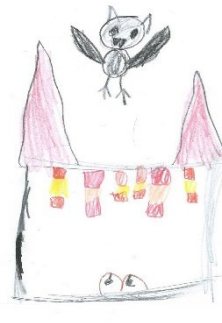
Fledermäuse (Leonie) Eine Folterkammer (Johannes)