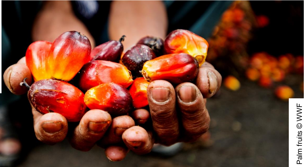
Palm fruits