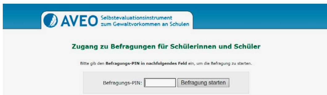
Grafik 2: AVEO Selbstevaluationsinstrument – Zugangportal

AVEO (Austrian Violence Evaluation Online Tool) ist ein Online-Selbstevaluationsinstrument zur Erhebung des Gewaltvorkommens in einzelnen Klassen (AVEO-S) mit direkter Rückmeldefunktion für Lehrkräfte sowie Schulleitungen. Es dient auch zur Selbstreflexion für LehrerInnen (AVEO-T). Das Verfahren wurde an der Universität Wien in Kooperation mit dem Bildungsministerium entwickelt und kann Lehrkräfte unterstützen, Gewalt und Mobbing besser zu erkennen.